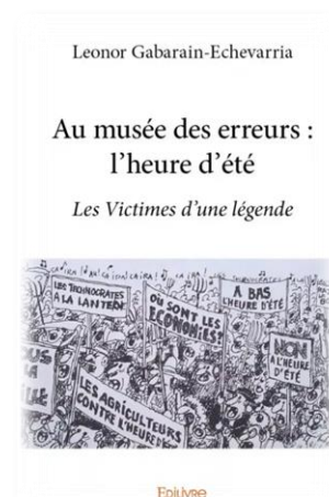
Figure 1 : Page de couverture livre (Ref 3)

Nous appelons les citoyens à demander une heure normale pour un sommeil et une santé meilleurs ainsi que pour un environnement plus propice à la réduction des émissions et à la protection du climat.