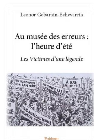
Figure 1 : Page de couverture livre (Ref 3)

Nous appelons les citoyens à demander une heure normale pour un sommeil et une santé meilleurs ainsi que pour un environnement plus propice à la réduction des émissions et à la protection du climat.